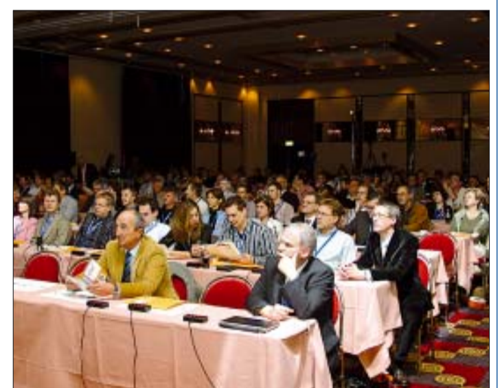
Gut besuchte Veranstaltung mit 300 Teilnehmern im letzten Jahr.

Das Programm am Samstag startet mit einer multimedialen Präsentation von Behandlungs- und Restaurationstechniken, bei denen das ideale Teamwork zwischen Zahnarzt und Zahntechniker zu herausragenden Restaurationen aus Vollkeramik führt. Eine Reihe von kürzeren Beiträgen aus der Praxis von Zahnärzten und Zahntechnikern sollen die