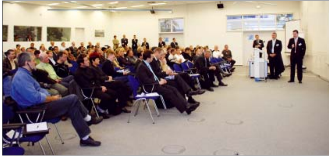
Kongresssteilnehmer beim 5. Anwendertreffen im Centrum Dentale Kommunikation in Ispringen.

programm im CCP (Congress Centrum Pforzheim) rundete den ersten lehrreichen Fortbildungstag ab. Während des Abendessens „entführte“ Clown Rinaldo die Gäste in eine traumhafte, bunte Welt mit viel Poesie und Gefühl, bevor zur Musik der Band „Lady Sue & the Lounge Princes“ bis in die frühen Morgenstunden getanzt wurde. Die sehr positive Beurteilung des Anwendertreffens durch die Teilnehmer bestätigt wieder einmal, dass Dentaurum Implants viel mehr als „nur“ ausgezeichnete Produkte anbietet. Fundierter und hochwertiger Service, der eindrucksvoll belegt, dass man den Kunden als langjährigen Partner schätzt. ZT