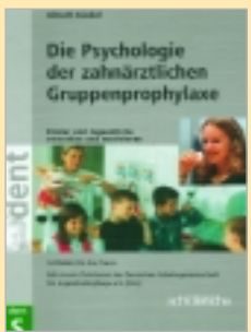
Almuth Künkel Verlag: Schlütersche Im Wert von € 29,90

Mit einem Geleitwort der Deutschen Arbeitsgemeinschaft für Jugendzahnpflege e.V. Die zahnärztliche Gruppenprophylaxe richtet sich an Kinder und Jugendliche in Kindergärten und Schulen. Ihr Ziel ist, die Mundgesundheit der Heranwachsenden zu verbessern, ernährungs- und pfllegebedingten Zahnkrankheiten vorzubeugen und die jungen Menschen zu motivieren, Verantwortung für die eigene Gesundheit zu übernehmen. Die Autorin gibt in diesem pädagogisch-psychologischen Leitfadern verständlich und in der Praxis erprobte Antworten.