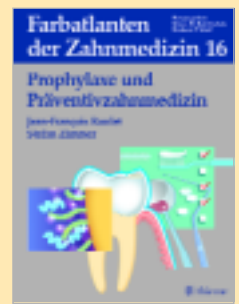
Jean-François Roulet, Stefan Zimmer Verlag: Thieme Im Wert von € 249,00

Ausführliche Beschreibung der häuslichen und professionellen Karies- und Parodontalprophylaxe. Tipps für die personelle und konzeptionelle Eingliederung der Prophylaxe in den Praxisablauf. Marketingkonzepte für die Praxis. Prophylaxe auch zum Schutz des Praxisteams. Topaktuell: Auswirkungen der Gesundheitspolitik. Zukunftsvisionen: Worauf muss sich der Zahnarzt einstellen? In der gewohnten Qualität der Farbatlanten. Schritt-für-Schritt-Anleitungen zur Vorgehensweise.