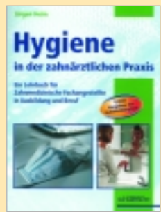
Jürgen Heim Verlag: Schlütersche Im Wert von € 19,90

Umfassend, kompakt und vor allem leicht verständlich stellt er das Thema Hygiene dar. Er beginnt mit einem mikrobiologischen Überblick und erläutert die in der Zahnmedizin relevanten Infektionskrankheiten. Nach den rechtlichen Bestimmungen folgt das eigentliche Kernstück des Buches: Detailliert beschreibt Jürgen Heim alle Teilbereiche der Praxishygiene. Das Lehrbuch orientiert sich eng an den Vorgaben des Rahmenlehrplans, der mit der Ausbildungsverordnung für Arzthelferinnen abgestimmt ist und die Grundlage für alle Länderlehrpläne bildet.