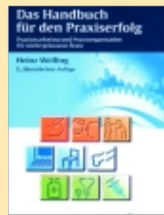
Heinz Welling Verlag: Thieme Im Wert von € 22,95

Dieses Buch behandelt leicht verständlich und umsetzbar die unternehmerische Führung der Praxis des niedergelassenen Arztes. Praxisoptimierung, Kosteneinsparung, Nutzung der EDV, Terminplanung u. Konsultation, Erfolgreiche Mitarbeiterführung, Ausbau Ihres Leistungsangebotes, Non-GKV-Leistungen als Ausweg aus der Honorarmisere, Prävention als Garant des Praxiserfolges, Patientenbindung und Service, Zukunftsperspektiven für niedergelassene Ärzte, Chancen der Einzelpraxis, Neue Versorgungsstrukturen, Qualitätsmanagement, Praxiswertermittlung, Regressvermeidung.