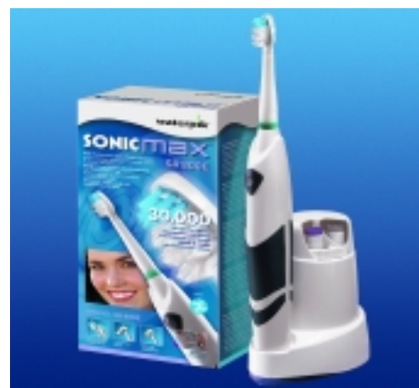
SONICMAX wurde in Zusammenarbeit von Zahnärzten und Technikern entwickelt.

Das Bensheimer Unternehmen intersanté als Exklusiv-Vertriebspartner der Waterpik Technologies bietet für den deutschen Markt die weltweit bekannten Prophylaxe-Produkte an.