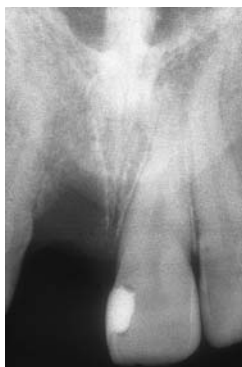
Abb. 1: Zustand nach Zahnextraktion 11 vor Eingliederung des ersten Provisoriums. – Abb. 2: Einzelröntgenaufnahme nach Zahnextraktion.