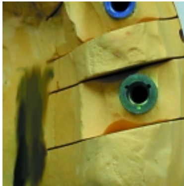
Modellimplantat in falscher Position – vestibuläre Kerbe leicht nach mesial gewandt.