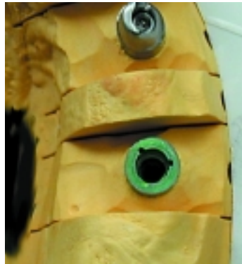
Modellimplantat in richtiger Position – vestibuläre Kerbe nach bukkal gewandt.