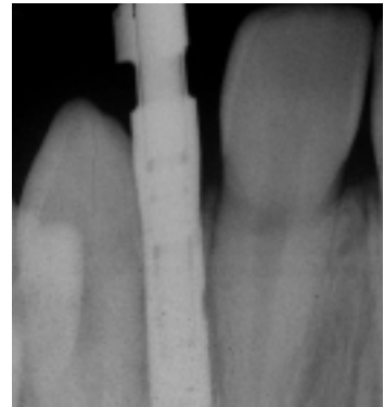
Die Röntgenkontrollaufnahme lässt den spaltfreien und exakten Sitz der Abformkappe prüfen.