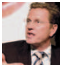
RA Dr. Guido Westerwelle – Bundesvorsitzender der FDP.