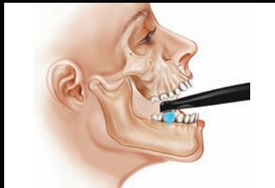
VALO mit einer Kopfhöhe von nur 11,4 mm erreicht auch posteriore Kavitäten mühelos und polymerisiert im optimalen Winkel.