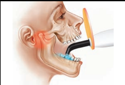
Konventionelle Lichtleiter benötigen extreme Mundöffnungen – oder führen zu unzureichender Polymerisation.