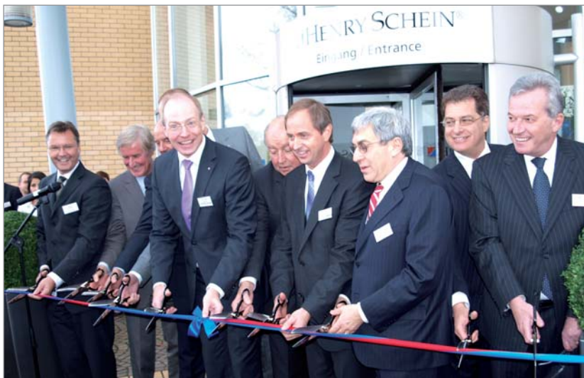
▲ Das symbolische Banddurchschneiden war einer der Höhepunkte der Feierlichkeiten in Langen.