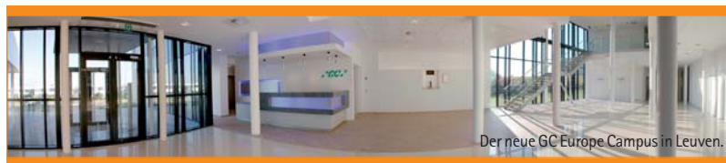
Der neue GC Europe Campus in Leuven.

Weitere Informationen zum neuen „GC Europe Campus“ finden Sie im Internet unter www.gceurope.com/toplevels/campus/