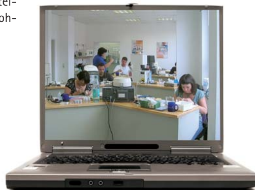
Der Meisterkurs M25.

Der im November beendete Kurs M 25 (vgl. Foto) ist in Thüringen der erste, für den die neue Meisterprüfungsverordnung Anwendung findet. Ziel dieser Verordnung ist es, ganzheitliche, handlungsorientierte, prozess- und projektbezogene Prüfungen durchzuführen, bei denen der unternehmerische Anteil stärker gewichtet wird. Die Fachpraxis setzt sich aus dem einem Kundenauftrag entsprechenden Meisterprüfungsprojekt (max. 9 Tage) und dem anschließenden Fachgespräch (max. 30 Minuten)