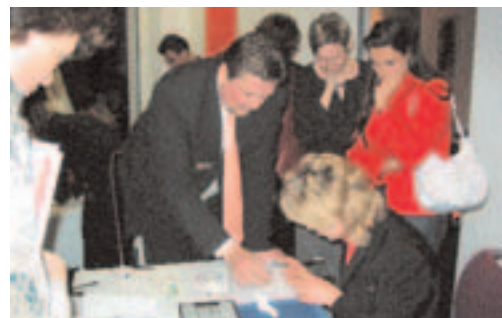
Reges Interesse aller Teilnehmer beim Hands-on-Training.

Möchten Sie auch minimalinvasiv Implantieren und das bei höchstem Patientenkomfort? Das ist jetzt ganz einfach mit dem neuen Konzept NobelDirect™ von Nobel Biocare. Denn mit der von Nobel Biocare und InteraDent präsentierten Roadshow durch Deutschland finden Sie den Einstieg in die Implantologie. NobelDirect™ ist ein biologisch einteiliges Implantat ohne Lappenbildung und mit Immediate Function™ zur Sofortversorgung der Implantate, verbunden mit der High-End-Ästhetik durch die vollkeramische CAD/CAM-Technik von Procera®. Die prothetische Versorgung ist dabei sehr komfortabel für Behandler und Patient bei wenig Implantatkomponenten. Der Einla-