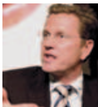
RA Dr. Guido Westerwelle – Bundesvorsitzender der FDP.