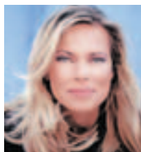
Nina Ruge – Gastgeberin des 7. Deutschen Zahnärzte Unternehmertages.