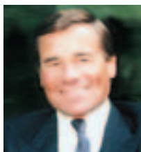
Wolfgang Grupp – Geschäftsführer der TRIGEMA.