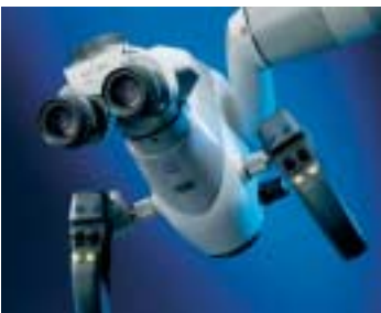
OPMI ® PROergo

pluradent bietet nun auch eine Reihe fein selektierter Exklusivprodukte als weitere Dienstleistung an, die die moderne Zahnarztpraxis auf dem Weg zum Erfolg unterstützen. Denn wer als Zahnarzt oder Dentallabor auch in Zukunft erfolgreich sein will, muss neue Wege gehen und offen sein für innovative Entwicklungen und Produkte.