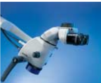
OPMI ® pico