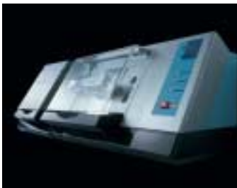
Brücken im Front- und Seitenzahnbereich mit Spannweiten bis zu 47 mm anatomischer Länge sind mit Cercon smart ceramics – hier die Bearbeitungseinheit – problemlos herzustellen.