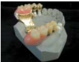
Neue Chancen für die Gestaltung prothetischer Arbeiten, die höchste Ansprüche an Ästhetik und Bioverträglichkeit erfüllen, bietet diese Kombination: Cercon + Galvanogold.