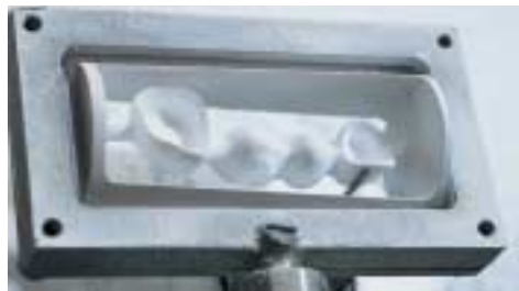
Als „Output“ liefert die Scan- und Fräseinheit ein präzises Kronen- oder Brückengerüst.