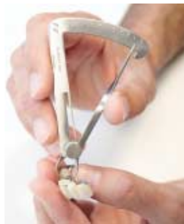
Eine abschließende, zusätzliche Qualitätskontrolle bei Semperdent in Emmerich garantiert optimale Verarbeitung und Ästhetik.