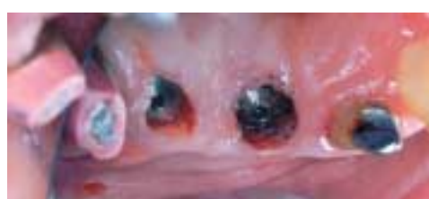
... und führt zur Blutstillung bei Präparationen.