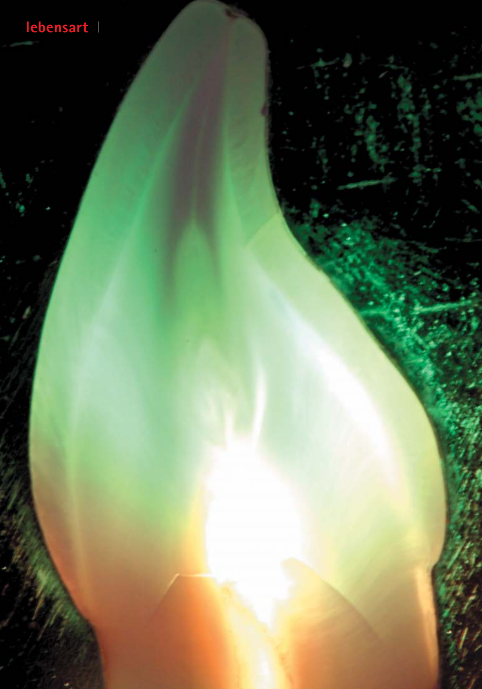
Caninus: Ein Eckzahn in Szene gesetzt.