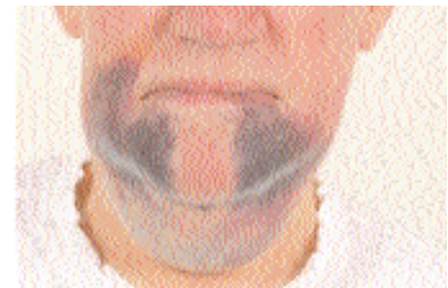
Abb. 2: Extraorale Hämatombildung nach Zahnextraktion bei einem gerinnungsgehemmten Patienten.

vierung der Blutgerinnungskaskade (Gerinnungsfaktoren), deren Aktivierung über das sog. intrinsische oder extrinsische System erfolgen kann. Der primäre Thrombozytentrombus wird durch Fibrin stabilisiert und unter Einschluss weiterer korpuskulärer Blutbestandteile entsteht ein der Gefäßwand anhaftender sog. „roter“ Thrombus. Im Anschluss daran muss das gebildete Fibringerinnsel durch eine funktionstüchtige Fibrinolyse wieder aufgelöst werden, damit die Heilung stattfinden bzw. das Blutgefäß rekanalisiert werden kann.