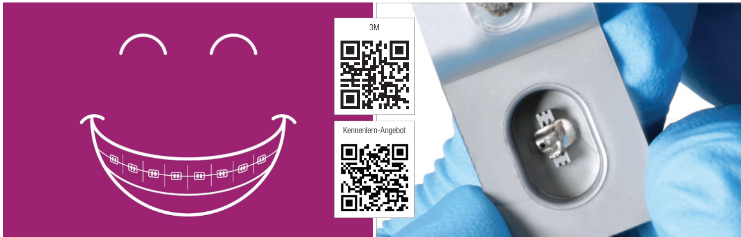
Abb. links: Gleich 32 Gründe zur Freude liefern Brackets und Tubes mit 3M APC Flash-Free Adhäsivvorbeschichtung. Abb. rechts: Neu bei 3M: 3M Victory Series Mini Tubes mit 3M APC Flash-Free Adhäsivvorbeschichtung.

Kürzere Stuhlzeiten, weniger Bracketverluste: Das sind nur zwei von 32 guten Gründen für den Einsatz von Brackets mit 3M APC Flash-Free Adhäsivvorbeschichtung. Sie alle sowie Details zu einer Produktneuheit enthüllt 3M im Rahmen der DGKFO-Jahrestagung.