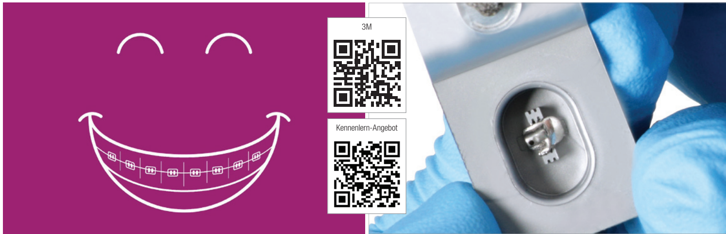
Abb. links: Gleich 32 Gründe zur Freude liefern Brackets und Tubes mit 3M APC Flash-Free Adhäsivvorbeschichtung. Abb. rechts: Neu bei 3M: 3M Victory Series Mini Tubes mit 3M APC Flash-Free Adhäsivvorbeschichtung.

Kürzere Stuhlzeiten, weniger Bracketverluste: Das sind nur zwei von 32 guten Gründen für den Einsatz von Brackets mit 3M APC Flash-Free Adhäsivvorbeschichtung. Sie alle sowie Details zu einer Produktneuheit enthüllt 3M im Rahmen der DGKFO-Jahrestagung.