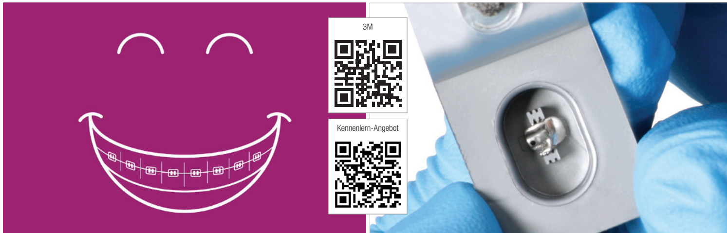
Abb. links: Gleich 32 Gründe zur Freude liefern Brackets und Tubes mit 3M APC Flash-Free Adhäsivvorbeschichtung. Abb. rechts: Neu bei 3M: 3M Victory Series Mini Tubes mit 3M APC Flash-Free Adhäsivvorbeschichtung.

Kürzere Stuhlzeiten, weniger Bracketverluste: Das sind nur zwei von 32 guten Gründen für den Einsatz von Brackets mit 3M APC Flash-Free Adhäsivvorbeschichtung. Sie alle sowie Details zu einer Produktneuheit enthüllt 3M im Rahmen der DGKFO-Jahrestagung.