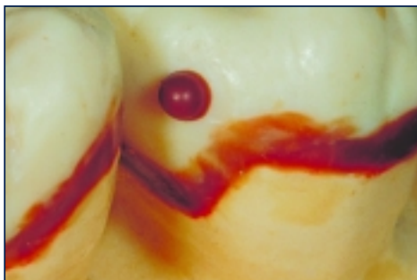
*(Abb. 2) S-U-ÄSTHETIKWACHS-A braun, für die Randgestaltung.