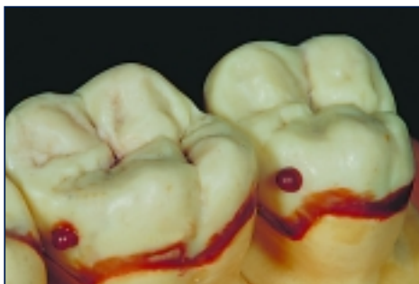
*(Abb. 3) S-U-ÄSTHETIKWACHS-A beige, für Kauflächen.