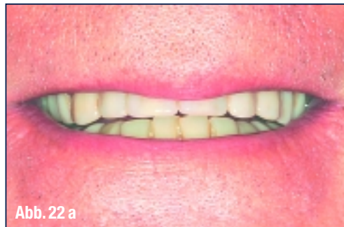
Abb. 22 a