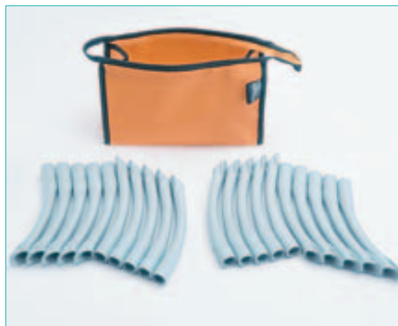
^ Die Dürr Universalkanülen sorgen für eine reibungslose Absaugung.

Oft entscheiden gerade die kleinen Dinge des Praxisalltags über den Erfolg vieler Stunden Arbeit. Zum Beispiel die Universalkanüle von Dürr Dental – dabei fällt ihre Anwesenheit nicht einmal auf, weil sie stets zuverlässig funktioniert, gut in der Hand liegt und ihren Dienst noch dazu besonders leise und bescheiden versieht. Aktuell verleiht dem Klassiker die neue Verpackung in einer peppig-gelben Kulturtasche einen frischen Touch. Der Universalkanüle von Dürr Dental zählt zu den unverzichtbaren Hilfsmitteln bei jeder Behandlung: Durch sie werden Speichel und Sekret abgesaugt, ebenso eine möglicherweise mit Keimen belastete Aerosolwolke. Das ergonomische Profil der Kanüle gewährleistet bei jeder Handhabungstechnik ein ermüdungsfreies Arbeiten. Die Vorteile lassen sich auch unmittelbar mit den Sinnen erfassen. So überzeugt der Klassiker selbst bei hoher Absaugleistung durch einen angenehmen lei-