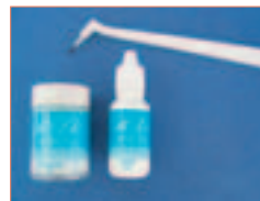
Hi-Lite – dieses Praxisbleaching-System ist einfach und zeitsparend anzuwenden.

xisbleachingssystem mit Farbindikator zur Überprüfung der Einwirkzeit. Die Vorteile dieses Zahnaufhellers liegen darin, dass er einfach und zeitsparend anzuwenden ist. Je nach Indikation kann das Produkt punktuell oder großflächig auf der Zahnaußenfläche oder direkt in der Kavität angewandt werden. Hi-Lite kann außerdem ohne Bleaching-Schiene verwendet werden und es löst keine Sensibilisierungen beim Patienten aus. Das Produkt ist ein-