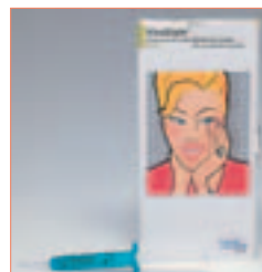
VivaStyle 30% verspricht eine kurze Behandlungsdauer und schnelle Ergebnisse.

VivaStyle 30% enthält den bewährten Wirkstoff Carbamidperoxid und stellt eine schonende Alternative zu hochkonzentrierten Wasserstoffperoxid-Produkten für die In-Office-Behandlung dar. Die Applikation des VivaStyle-Gels erfolgt mit Hilfe individuell hergestellter Trays. Während das Gel seine Wirkung entfaltet, kann der Patient entspannt im Wartezimmer sitzen. So steht die Behandlungseinheit in dieser Zeit anderweitig zur Verfügung. Normalerweise