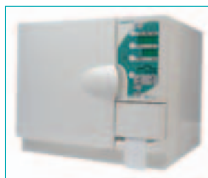
Mit dem QUANTIM B Vakuumautoklaven einfach und sicher sterilisieren.

Die Eigenschaften und Vorteile dieses Autoklaven erhöht die Effizienz der Sterilisation in der Praxis. Der QUANTIM B erfüllt die Anforderungen der prEN 13060, und ist für die Sterilisation von Hohlräumen als auch verpackten oder unverpackten po-