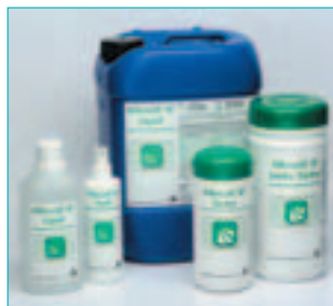
Mikrozid® AF – aldehydfreie Desinfektion.

Wer also sicher gehen will, dass das verwendete Präparat aldehydfrei ist, sollte nur Produkte verwenden, die entsprechend ausgelobt sind. Mit Schülke & Mayr-Präparaten