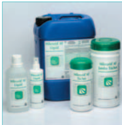
Mikrozid® AF – aldehydfreie Desinfektion.

vielfach Aldehyde (z.B. Glyoxal) nicht als solche erkannt werden.