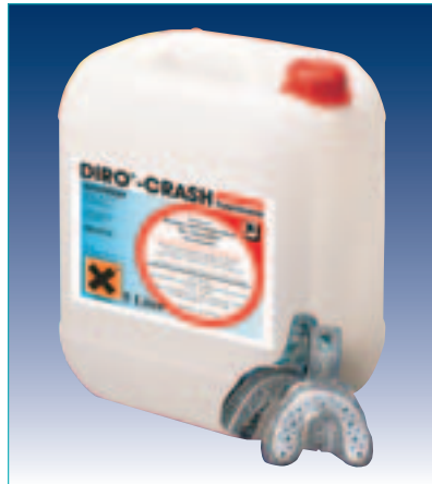
Der Abdrucklöffel-Reiniger von BEYCODENT.

Die verschmutzten Löffel werden einfach in eine Wanne mit der Gebrauchslösung gegeben – bereits nach ca. 20 Minuten