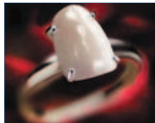
Einzigartiger und natürlicher Glanz mit BisCover.

Behandlung wird komfortabler und angenehmer für Arzt und Patient. Das Ergebnis ist ein wunderschönes Lächeln und erhöhte Patientenzufriedenheit. BisCover