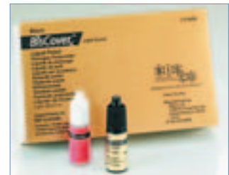
Neue flüssige Politur für Kompositrestaurationen von Bisco.

wird exklusiv von US Dental in Deutschland vertrieben und kostet zwischen 30,00 und 60,00 € zzgl. MwSt. je nach Packungsgröße.