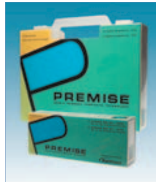
Das All-in-one Komposit für die universelle Anwendung.

Das Handling des Materials ist durch die gute Formstabilität und die Eigenschaft nicht zu verkleben bestens. Es ist, dank ausgezeichneter Materialfestigkeit und lang anhaltender Ästhetik, für die