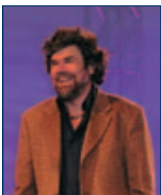
▲ Bergsteiger-Legende Reinhold Messner.

■ Wie bereits in 2004 erfolgreich eingeführt, bildete auch in diesem Jahr ein Pre-Kongress am ersten Tag den Auftakt des wiederum hochkarätig besetzten Vortragsmarathons.