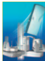
• Orthoralix 9200 DDE bietet digitales Röntgen mit einem breiten Indikationsspektrum am Arbeitsplatz.

die automatische Belichtungskontrolle (AEC) und das ergonomische Design unterstützt den hohen Anspruch. Bereits die Standardversion verfügt über ein breites praxisgerechtes Spektrum an Programmen und Projektionsmöglichkeiten: Standardpanorama, Kinderprojektion, Front- und Orthogonalstatus, Panorama Halbseite und Kiefergelenke lateral. Erweiterte röntgendiagnostische Möglichkeiten für chirurgische und implantologische Fragestellungen deckt die „Plus-Version“ ab: Transversale