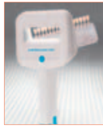
Demetron Shade Light ermöglicht Zahnfarbbestimmung unter Tageslichtbedingungen.

Das Gerät besticht durch seine Fortschrittlichkeit, denn es ist die derzeit einzige wirklich neutrale Tageslicht-Farbblende auf dem Markt. Es ist mit einer Triphosphor-RGB-Fluoreszenzlampe mit kalter Diode und 6.500 K ausgestattet. Demetron Shade Light überzeugt auch durch sein gutes Preis-Leistungs-Verhältnis. Denn dank der präzisen Farbbestimmung kann teures