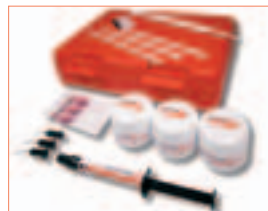
Mit diesem Kit erreicht der Zahnarzt eine hochwertige Zahnaufhellung in der Praxis.

Gepflegte, weiße Zähne vermitteln den Eindruck der Ju-