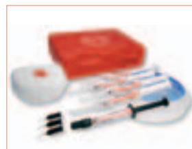
Eine schonende und wirksame Aufhellung ist mit BioSmile home möglich.

Bleaching-Material für den Patienten, für die schonende und wirksame Zahnaufhellung zu Hause. Das Set enthält Bleaching Gel (10 % Carbamidperoxid), Tiefziehfolien, Blockout-Material und eine attraktive Kunststoffdose, die auch als Lunch-Box verwendet werden kann.