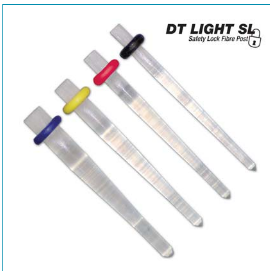
DT Light SL Quarzfaserstifte von VDW.

Eine Schutzschicht aus Polymer verhindert, dass sie vor dem Kontakt mit dem Zement kontaminiert oder deaktiviert wird. Die bessere Adhäsion erhöht die Sicherheit im Sinne einer langfristigen Versorgung, die