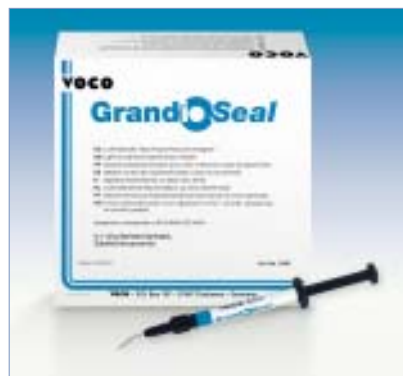
◀ Keine Kompromisse beim Fissurenversiegeln.

Fissurenversiegelungen zählen zum Standard-Repertoire moderner Prophylaxe-konzepte. Doch die Entscheidung für das richtige Material zur Versiegelung ist schwer. Viele Zahnärzte stehen vor der