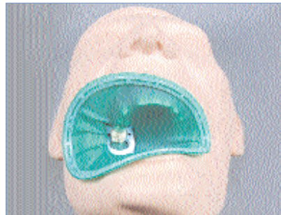
◀ Einfaches Anlegen.