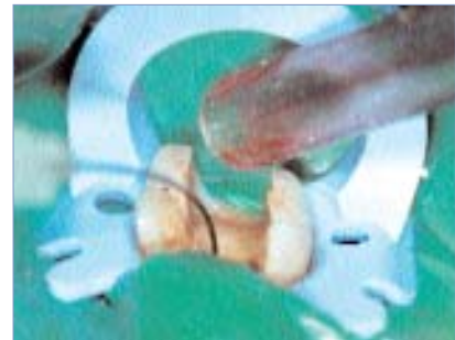
◀ Absolute Trockenlegung.

Mit dem InstiDam von Zirco bietet LOSER & Co ein einfaches Kofferdam-Konzept für die absolute Trockenlegung an. Der Kofferdam ist für das rasche Einsetzen in den Mund fertig vorbereitet. Er ist auf einem runden flexiblen Fertigrahmen montiert. Etwas aus der Mitte verschoben befindet sich bereits eine Perforation. Das