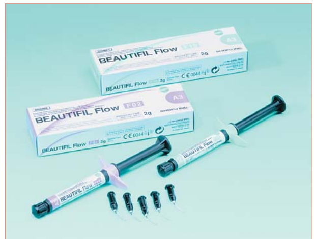
Beautifil Flow weist hervorragende ästhetische und physikalische Eigenschaften auf.