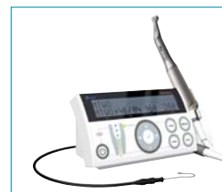
• Multifunktionaler Endomotor VDW.GOLD mit integriertem Apex Locator.

hat bei der Auswahl seines NiTi-Systems die größtmögliche Flexibilität, denn erstens sind alle wichtigen Feilensysteme einprogrammiert und zweitens können eigene Werte individuell gespeichert werden. Bei der Entwicklung wurde großer Wert auf praxisrelevante Funktionen und schnörkellos einfache Bedienung gelegt. Sicherheitsfeatures wie Drehmomentsteuerung, akustische Signale und