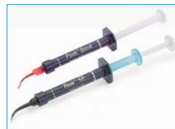
• Peak Dental Adhäsiv System – immer frisch, immer zuverlässig, immer stark.

Als ersten Schritt kann entweder – gemäß der Total-Etch-Technik – das bekannte Phosphorsäure-Ätzel Ultra-Etch angewendet werden. Alternativ für die Self-Etch-Technik gibt es nun Peak SE Primer, der nicht abgespült wird: Dank der speziellen Jet-Mix-Spritze steht zur Behandlung jeweils frisch angemischter Primer zur Verfügung. Zusätzliche Misch-Hilfsmittel sind unnötig; das Anmischen erfolgt direkt in der Spritze, und aus der Spritze wird direkt appliziert. Der Primer bleibt nach der Anmischung 30 Tage lang stabil.