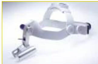
• EyeMag™ Pro S