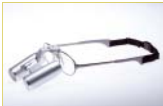
• EyeMag™ Pro F

Das neue EyeMag™-Programm umfasst unterschiedliche Kopflupen, die sowohl für den Erstanwender als auch für den professionellen Anwender mit hohen Anforderungen an die Vergrößerung attraktiv sind. „Kopflupen sind für unsere Kunden ein wichtiges Arbeitsmittel, um die Arbeitsqualität zu erhöhen. Nur was der Arzt sieht, kann er auch behandeln. Wir freuen uns, pluradent