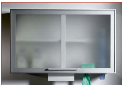
▲ Der neue Hygieneschrank 1000 von Le-iS Stahlmöbel.

Mit dem Hygieneschrank 1000 hat Le-iS Stahlmöbel einen Einrichtungsgegenstand entwickelt, der in Funktion, Ergonomie, De-