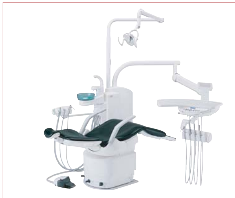
▲ Verlässlichkeit und höchste Qualität – Die Behandlungseinheit Clesta II überzeugt in jeder Lage mit Stabilität und Lebensdauer.

Der Erfolg von Clesta beruht auf dem nahezu unverwüchtlichen ölhydraulischen Stuhlantrieb, der keinerlei Gewichtsbeschränkungen kennt und maximale Betriebssicherheit gewährleistet. Leise, ruckfreie Bewegungsabläufe stehen dabei für Wohlbefinden und entspanntes Behandeln.