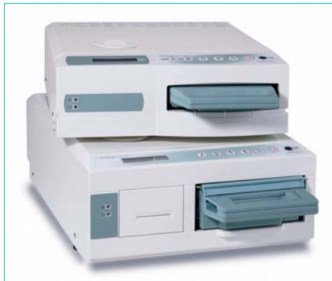
Die Kassettenautoklaven STATIM 2000S und 5000S sind schnell, kompakt und wirtschaftlich.

Kurzes Gelände 10 86156 Augsburg Tel.: 08 21/56 74 56-0 Fax: 08 21/56 74 56-99 www.scican.com