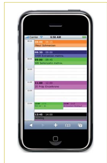
▲ Tagesansicht mit dem iPhone.