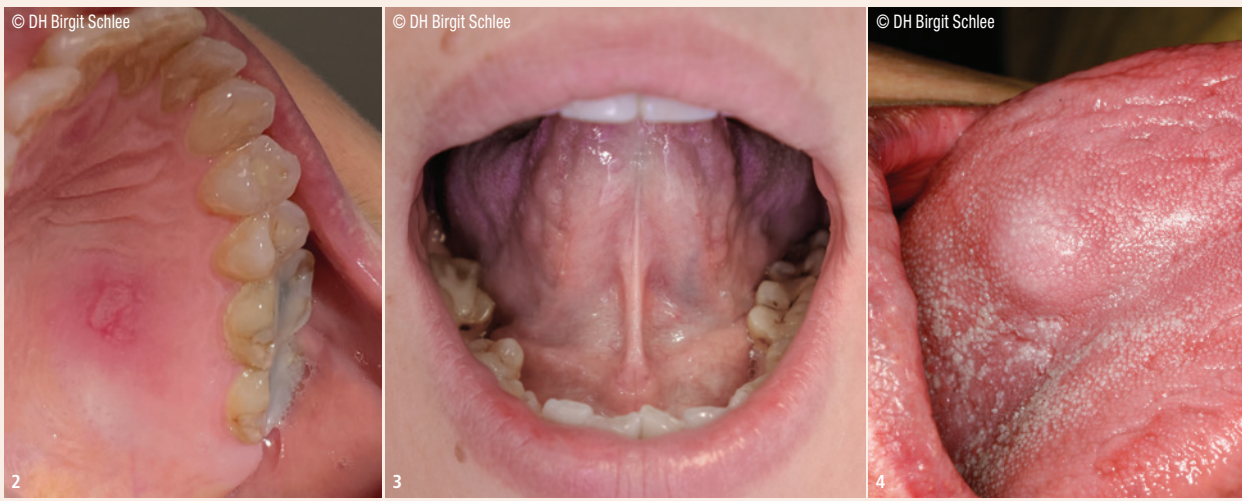
Abb. 2: Verletzung am Gaumen durch harte und kantige Nahrung (Brotkruste). – Abb. 3: Inspektion des Zungenbodens durch Anheben der Zunge. – Abb. 4: Feststellung karzinogener Veränderung an der Zunge bei der Zahnreinigung.

Rhagaden führen. Dieselben Symptome können jedoch auch auf einen Nährstoffmangel (Eisen, Vitamin B12) hinweisen. Gerade bei Rauchern sollte auf Hautveränderungen an der Lippe geachtet werden, weil hier direkter Hautkontakt mit schädigenden Substanzen vorliegt.