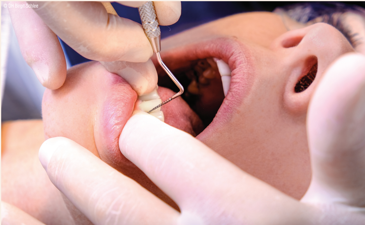
Abb. 5: Befunderhebung mit einer millimeterskalierten PA-Sonde der Indizes.