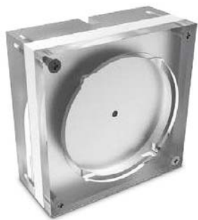
2D Prüfkörper (Listenpreis: 981,-€ netto)

Beim Erwerb von einem DEXIS OP3D Pan erhalten Sie den Prüfkörper kostenlos und zusätzlich 1.000€ Rabatt auf den Scan Exam One oder DEXIS Titanium Sensor