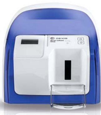
DEXIS Scan eXam™ One Speicherfoliensystem (Listenpreis: 6.300,-€ netto)