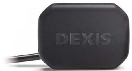
DEXIS Titanium™ Intraoraler Sensor (Listenpreis: 6.100,-€ netto)