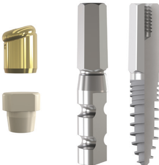
Hybrid-Implantat – fest-sitzend und flexibel herausnehmbar.