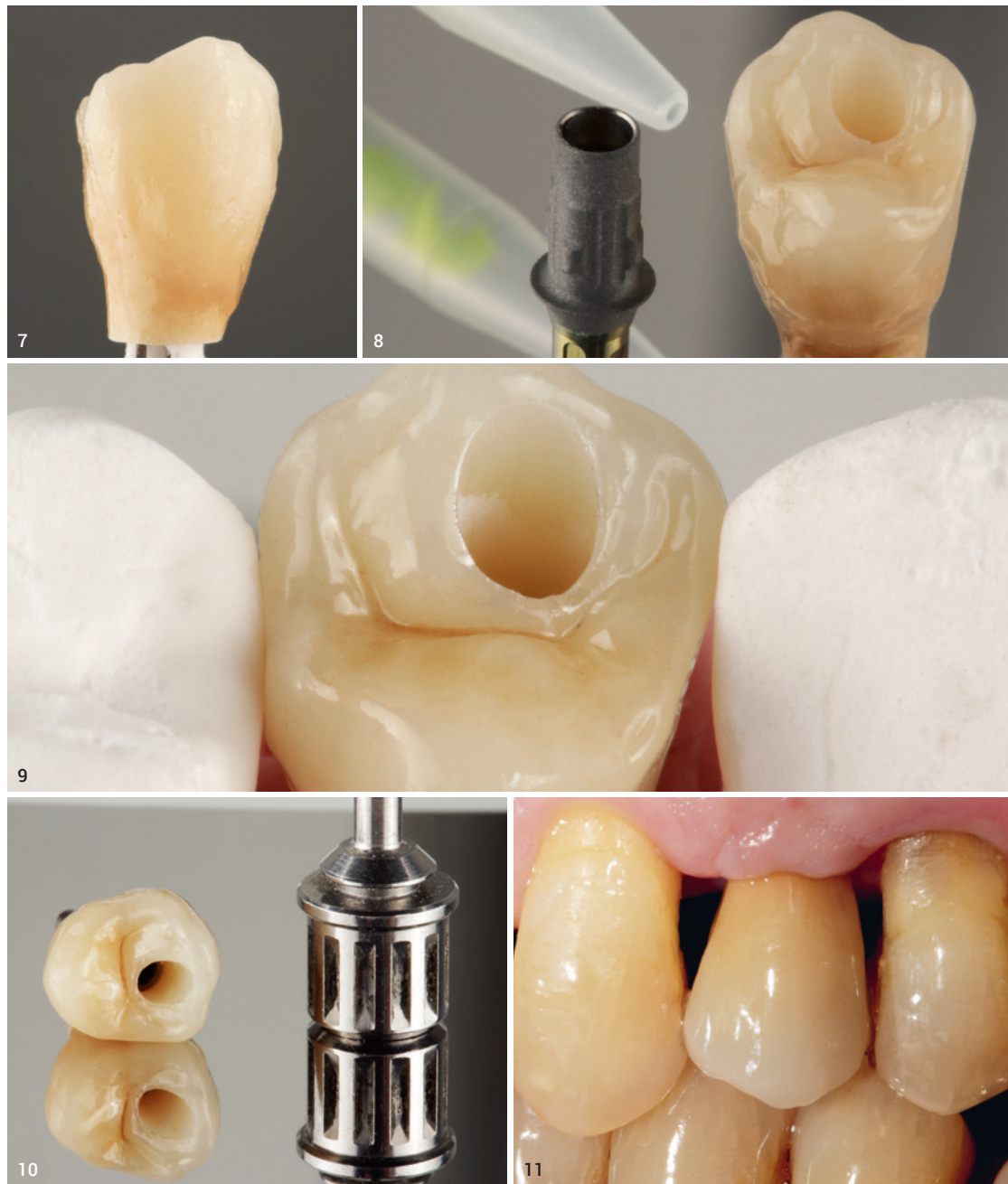
Abb. 7: Fertig verblendet und nach dem Einarbeiten der Oberflächentextur finalisiert. Abb. 8: Verkleben der Hybrid-Abutmentkrone auf der Titanbasis. Abb. 9: Passungskontrolle auf dem Modell. Abb. 10: Hybrid-Abutmentkrone verklebt auf Titanbasis, zum Verschrauben im Mund vorbereitet. Abb. 11: Restauration nach dem Verschrauben auf Implantat in Regio 14.

Das Verkleben einer Krone mit der Titanbasis bedarf eines zuverlässigen