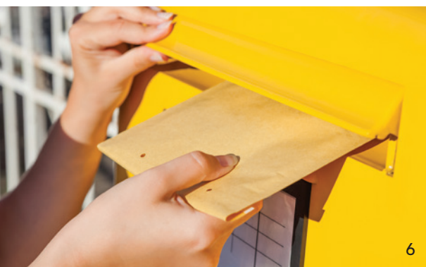
Briefe schreiben ist ein Anfang – Protest gegen das GKV-Finanzstabilisierungsgesetz.