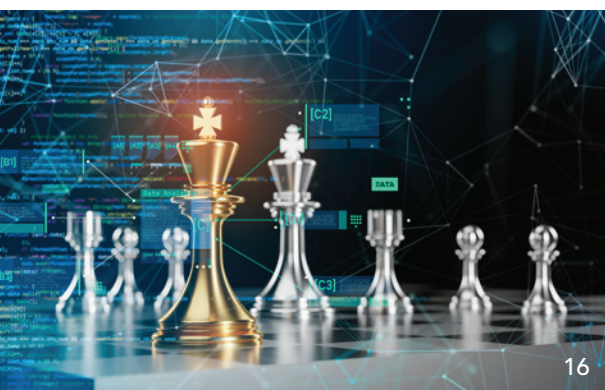
Digitaler Aufbruch? Bundeskabinett will auch das Gesundheitswesen weiter digitalisieren.