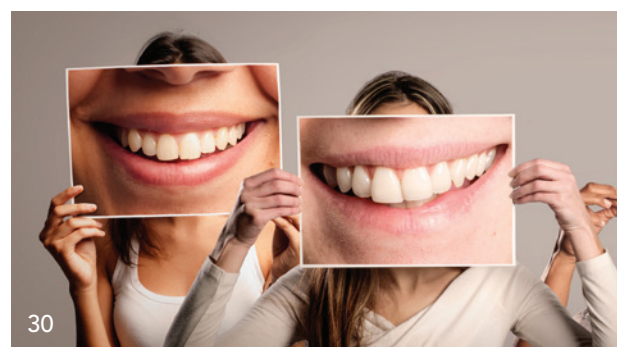
30 Im Oktober fällt der Startschuss für die Sechste Deutsche Mundgesundheitsstudie – DMS 6.