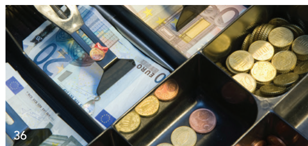
36 Barzahlungen von Patienten können tückisch sein – Die KZVB zeigt Alternativen auf.