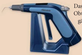
System B™ Fill: Füllgerät, 3-23G & 3-25G Nadeln, Ladegerät, 2 Batterien, Stand, Reinigungszubehör.

Schnelles, effizientes Arbeiten mit dem System B™ Cordless Obturation System.