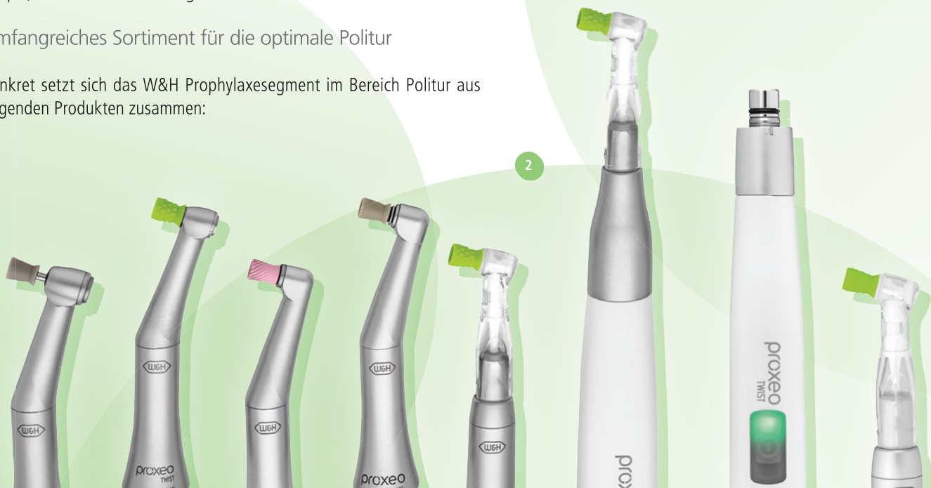
Abb. 2: Produkt-Power im Segment Prophylaxe: Die W&H Proxeo Hand- und Winkelstücke unterstützen eine effiziente Behandlung durch ergonomisches Design mit einem kleinen Kopf sowie optimale Drehzahlen direkt am Zahn.

Konkret setzt sich das W&H Prophylaxesegment im Bereich Politur aus folgenden Produkten zusammen: