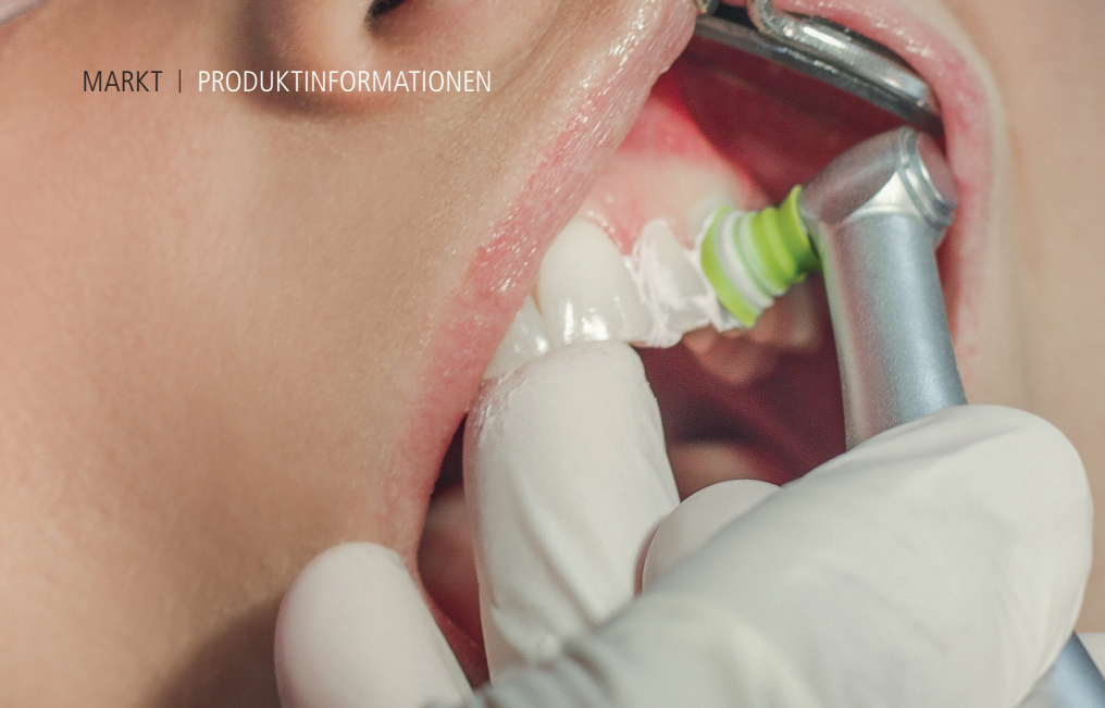
1 Abb. 1: Durch die LatchShort-Technologie und die dazugehörigen Prophy-Kelche wird den Behandlern der Zugang zu schwer zugänglichen Zahnoberflächen erleichtert. Gleichzeitig bietet der um 4 mm kürzere Kopf auch mehr Komfort für Patienten mit einem kleineren Mund oder Beschwerden im Kiefergelenk.