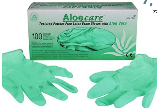
Premium Aloe Care Latex Handschuhe Box (Inhalt je 100 Stück)