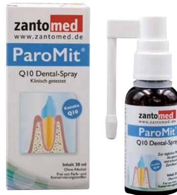
ParoMit® Dental-Spray, 30 ml

Unterstützt die Heilungsfunktion im Weichgewebe. Ideal nach oralchirurgischen Eingriffen bei Blutungs- und Entzündungsrisiken.