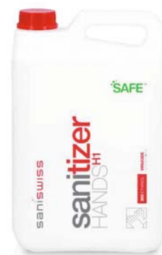
Biosanitizer H1 flüssig 5.000 ml

Saniswiss biosanitizer H1 ist ein hydroalkoholisches Desinfektionsmittel für die hygienische und chirurgische Händedesinfektion ohne Wasser.