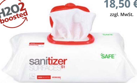
Saniswiss Sanitizer S1 Wipes, 100 St.

Umweltfreundliche Premium Mikrofaserwipes für die Reinigung und Desinfektion von empfindlichen Oberflächen. Frei von Aldehyden, Phenolen oder Alkohol.