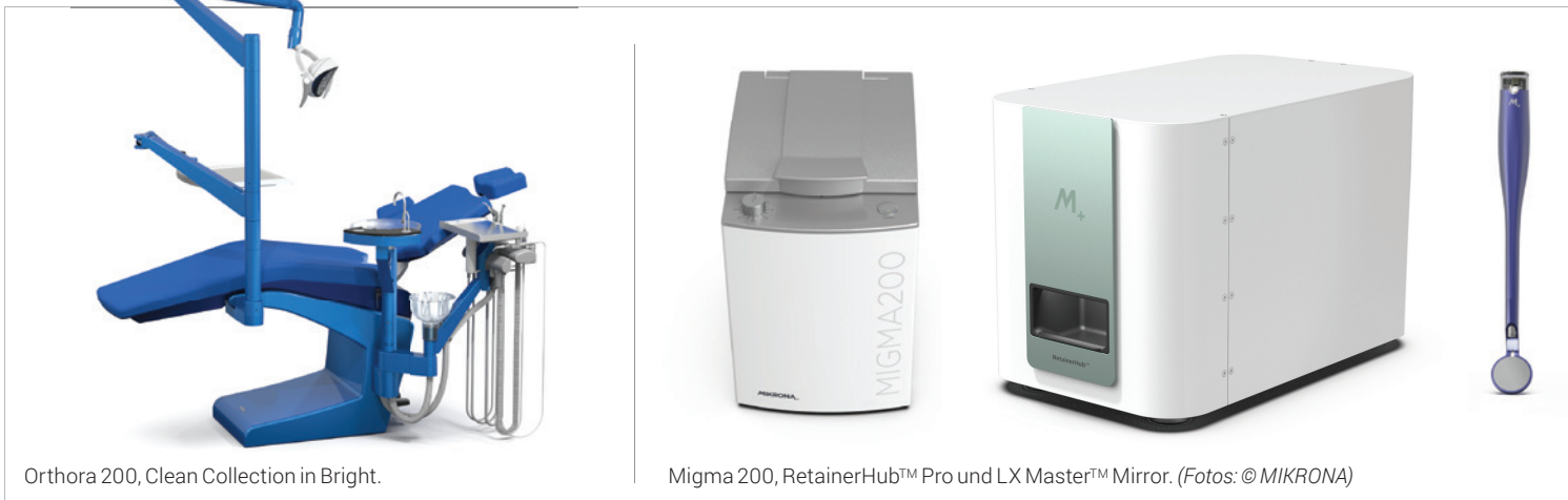
Orthora 200, Clean Collection in Bright.

Die im Jahr 2020 aus der MIKRONA TECHNOLOGIE AG und der ORTHO WALKER AG neu formierte Schweizer MIKRONA GROUP AG ist der Partner der Wahl, wenn es um praxisbewährte kieferorthopädische Lösungen geht. MIKRONA-Produkte und -Prozesse stehen für Zuverlässigkeit, Professionalität und Innovation.