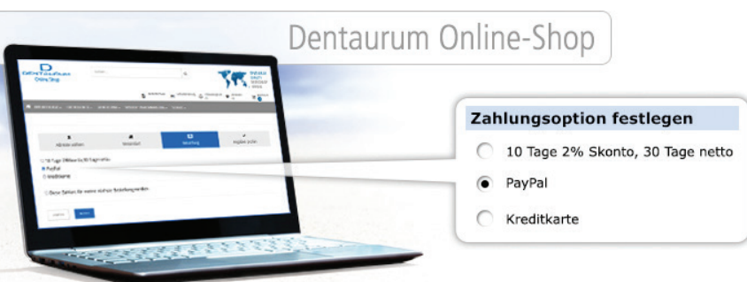
PayPal – neue Zahlungsoption im Dentaurum Online-Shop.

Dentaurum bietet ab sofort Live-Chat-Funktion und PayPal.