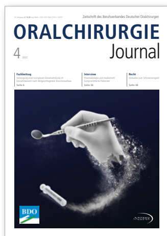
Titelbild: EthOss® – Grow Stronger als Leitbild Exklusivvertrieb www.zantomed.de