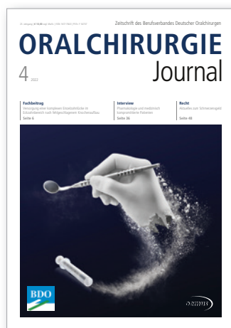
Titelbild: EthOss® – Grow Stronger als Leitbild Exklusivvertrieb www.zantomed.de