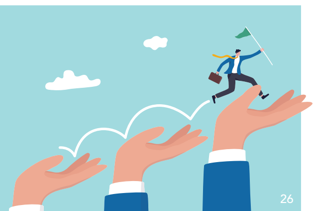
BLZK und KZVB fördern den standespolitischen Nachwuchs.