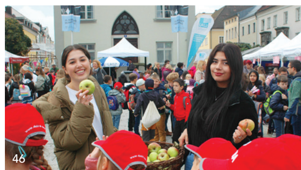
Zwei Praxismitarbeiterinnen verteilten Äpfel beim „Tag der Zahngesundheit“. Über 1 000 Jungen und Mädchen nahmen an dem Kinderfest in Deggendorf teil.