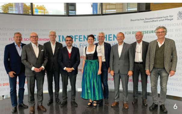
Hochrangige Vertreter des deutschen Gesundheitswesens übten beim Gipfeltreffen massive Kritik an Gesundheitsminister Lauterbach.