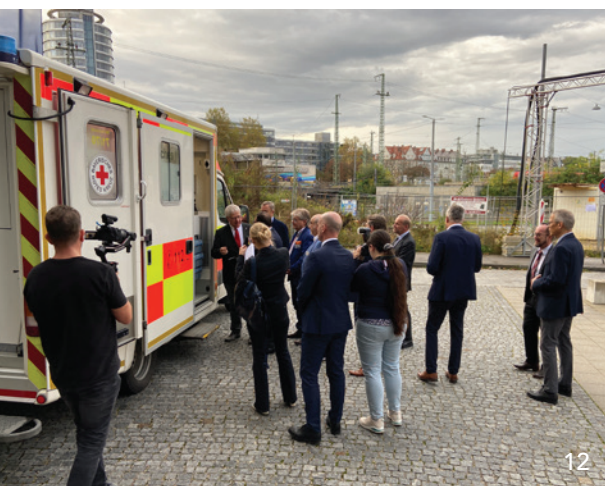
Bei einem Pressetermin der LAGP wurde die „Mobile Zahnarztpraxis“ vorgestellt. Sie ist in einem Rettungswagen des BRK untergebracht.