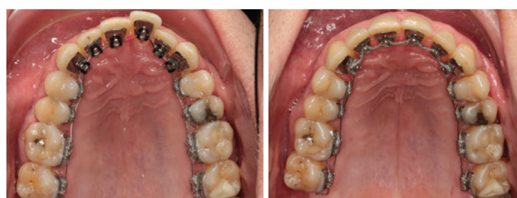
Lingualtechnik: unsichtbar, schnell und zuverlässig. Innerhalb von drei Monaten hat eine deutliche Ausformung der Front stattgefunden.

Frau Lena Minutillo Reitmorstraße 25 80538 München Tel.: +49 89 189046-12 Fax: +49 89 189046-16 congress@bb-mc.com www.bb-mc.com oder unter: www.dglo.org