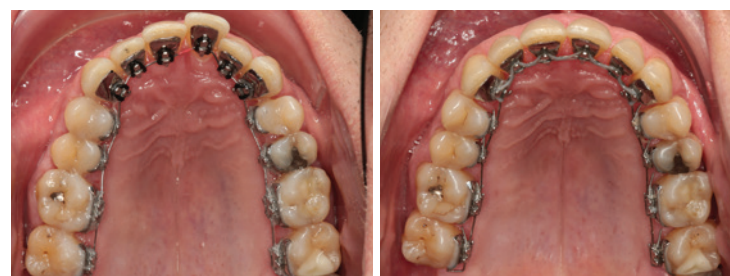
Lingualtechnik: unsichtbar, schnell und zuverlässig. Innerhalb von drei Monaten hat eine deutliche Ausformung der Front stattgefunden.