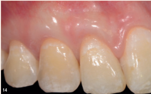
Abb. 11: Lateral geschlossener Tunnel im Bereich von 41. – Abb. 12: Koronal mobilisierter und geschlossener Tunnel im Bereich 14–12. – Abb. 13: Das klinische Bild ein Jahr nach der Therapie zeigt eine fast komplette Deckung der Rezession. Durch den Gewinn befestigter Gingiva ist die Durchführung von Mundhygienemaßnahmen deutlich verbessert. – Abb. 14: Ein Jahr nach der Therapie wurde eine komplette Deckung der OK-Rezessionen und eine Verbesserung des ästhetischen Erscheinungsbildes erreicht.