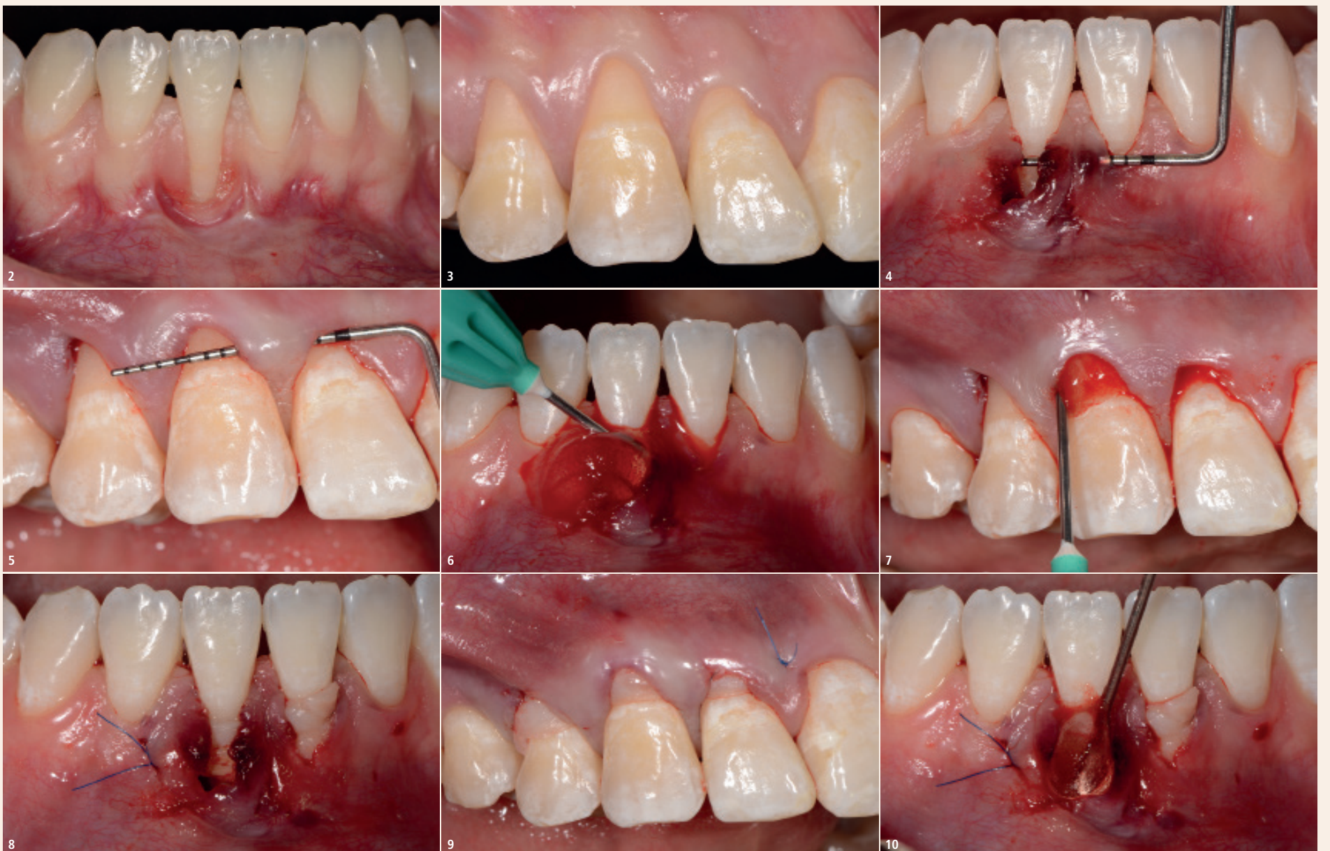
Abb. 2: Tiefe Klasse 2-Rezession in der UK-Front. Eine ausgeprägte Gingivitis und ein Höhenverlust der interdentalen Papille sind erkennbar. – Abb. 3: Multiple Klasse 1-Rezessionen in der OK-Front beeinträchtigen das ästhetische Erscheinungsbild. – Abb. 4: Präparierter Tunnel im Bereich von 41 und 31. – Abb. 5: Präparierter Tunnel im Bereich von 14–11. – Abb. 6 und 7: Applikation der quervernetzten Hyaluronsäure auf die Wurzeloberfläche und in den Defekt. – Abb. 8 und 9: Das SBGT wurde mit Umschlingungsnahten an den Zahnhälften fixiert. – Abb. 10: Eine zweite Schicht der quervernetzten Hyaluronsäure wurde auf das SBGT appliziert.

Da in diesen klinischen Situationen, durch die großflächige Präparation des Tunnels, eine stärkere Blutung entstehen kann, führt die Applikation von Hyaluronsäure zu einer Stabilisierung des Blutkoagulums und damit einer positiven Beeinflussung der Wundheilung (Abb. 2–14). Die Ergebnisse von zwei kürzlich veröffentlichten Fallstudien konnten zeigen, dass die Kombination von Hyaluronsäure und einem SBGT mit verschiedenen Variationen der Tunneltechnik in einer komplikationsfreien Heilung und einer exzellenten Deckung von singulären und multiplen Rezessionen im Ober- und Unterkiefer führt (Guldener et al. 2020, Lanzrein et al. 2020; Abb. 13 und 14).