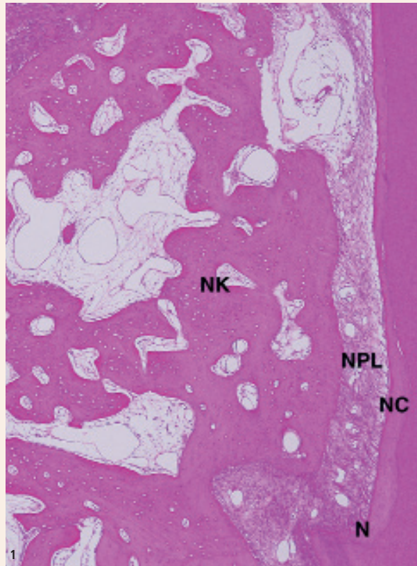
Abb. 1: Das histologische Bild zeigt die Regeneration parodontaler Strukturen in einem intraossären Defekt nach Behandlung mit einer quervernetzten Hyaluronsäure (hyaDENT BG, REGEDENT). N: die Kerbe zeigt den tiefsten Punkt des Defekts während des chirurgischen Eingriffs, NC: neues Wurzelzement, NPL: neues Desmodont, NB: neuer Knochen.

Aufgrund der vorher erwähnten biologischen Eigenschaften wurde die quervernetzte Hyaluronsäure (hyaDENT BG, REGEDENT)